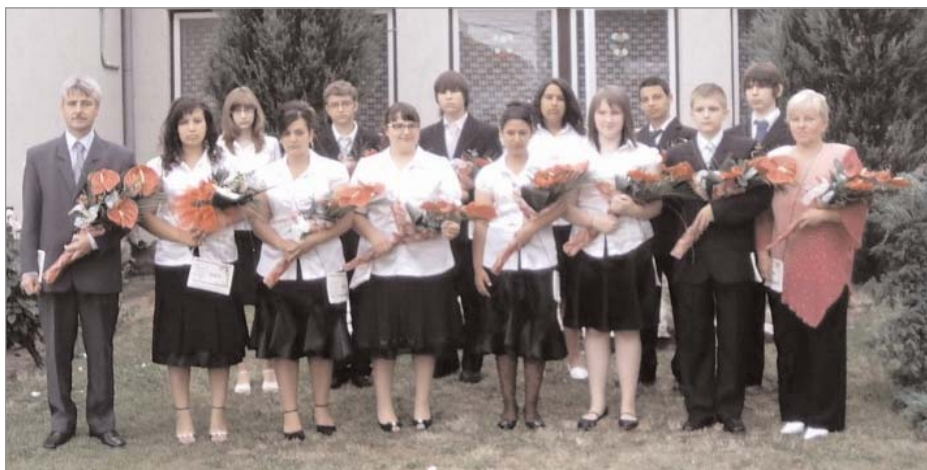
A ballagó nyolcadik osztály névsora:

➤ Örömmel számolhatunk be a 4-6-8. osztályosainknak megyei feladatsoron - olvasás-szövegértés - elért eredményeinek javulásáról.